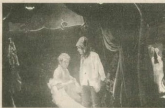
Napoléon et Nelson sont sur un bateau... À la fin Olga prend le large.

Lesquels s'écrit, en fait, pour la chair de la belle Olga, di-