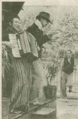
Cie Babylone

Novembre 1895. Dans la Tour, petit drame en trois actes, c'est dans un univers digne des films de Charly Chaplin, Méliès et autres grands maîtres du cinéma