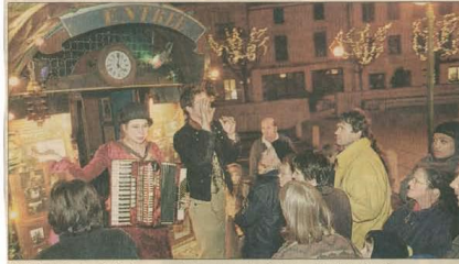
Petite introduction folklorique avant chaque représentation, sur la place Reggio.

● La compagnie Babylone se produira à nouveau ce week-end, à neuf reprises, sur la place Reggio. Aujourd'hui : cinq représentations de « La tour » et de « A feu et à sang », à 15 h, 15 h 45, 16 h 30, 21 h et 22 h. Demain dimanche : quatre séances de « A feu et à sang » à 17 h, 18 h, 20 h 30, et 21 h 30. Spectacle gratuit. Le nombre de places étant limité, les billets sont à retirer un quart d'heure avant le début de chaque séance.