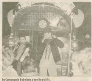
La Compagnie Babylone a ravi le public.