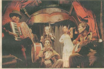
Tour à tour, comédiens et musiciens se retrouvent tous sur scène pour le final.

Privilégiés Au fond, la quarantaine de spectateurs a même le sentiment de faire partie des « happy feu », cette poignée de