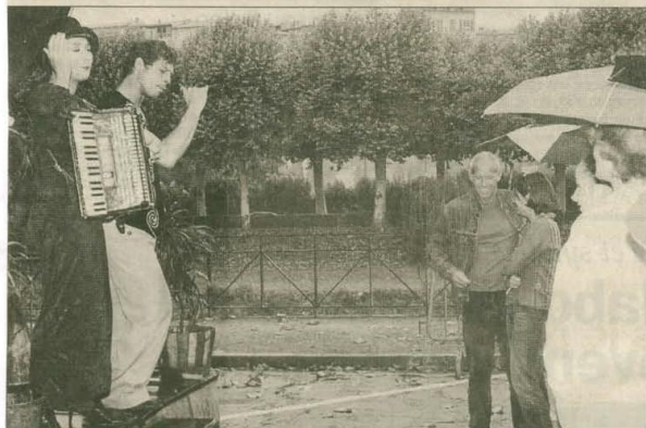
La compagnie Babylone donnera cinq représentations aujourd'hui à Auch.

Dans le cadre de la saison culturelle des « circuits nomades », Auch accueille la compagnie Babylone, quai Lissagaray. Déjà sur les lieux hier, cette joyeuse troupe de